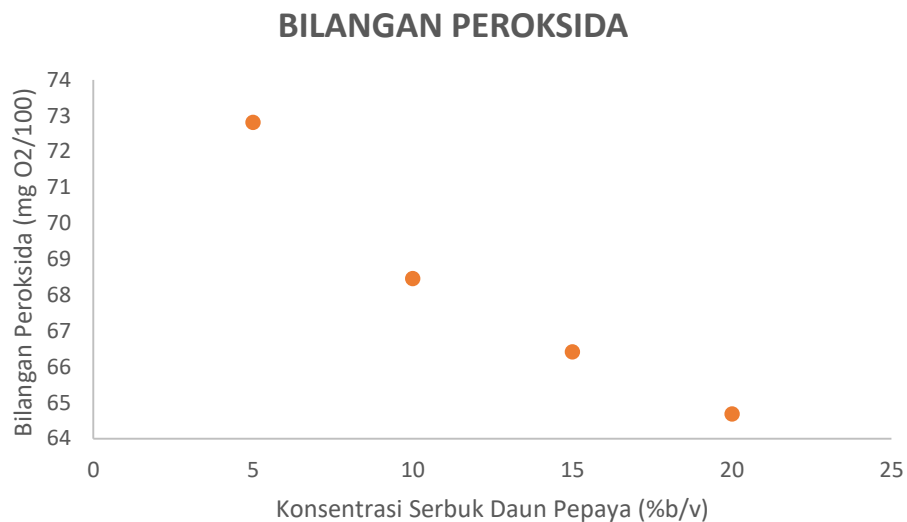
Gambar 1. Konsentrasi serbuk daun pepaya vs Bilangan peroksida

ditambah dengan serbuk daun pepaya daun pepaya selanjutnya disaring konsentrasi 5 %b/v; 10 %b/v; 15 %b/v dan kemudian ditetapkan bilangan 20 %b/v dan diaduk menggunakan shaker peroksidanya dan didapatkan hasil selama satu hari. Minyak jelantah yang sebagai berikut: telah direndam ditambah dengan serbuk