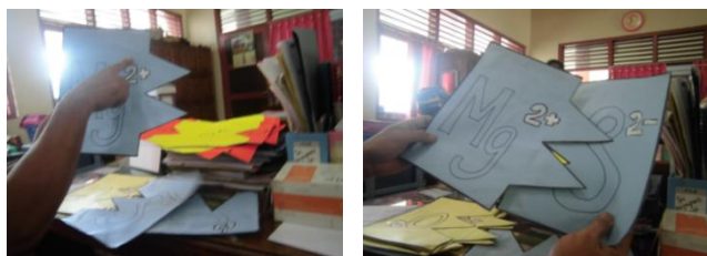
Gambar 2. Alat peraga pembentukan ikatan ionik yang dibuat oleh siswa

koloid, MY memberikan tugas makalah dan dipresentasikan. Dengan demikian, siswa dapat menggali informasi jauh lebih banyak. Untuk materi yang sarat dengan perhitungan, MY biasa menggunakan metode drill dan mengambil beberapa soal untuk didiskusikan. Untuk materi bentuk molekul, MY menggunakan molymode sebagai alat peraga. Selain itu, MY juga aktif untuk memberikan tugas membuat alat peraga. Sebagai contoh alat peraga konsep ikatan ionik yang diperlihatkan pada Gambar 2.