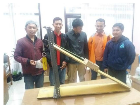
Gambar 2. Foto sampel alat peraga