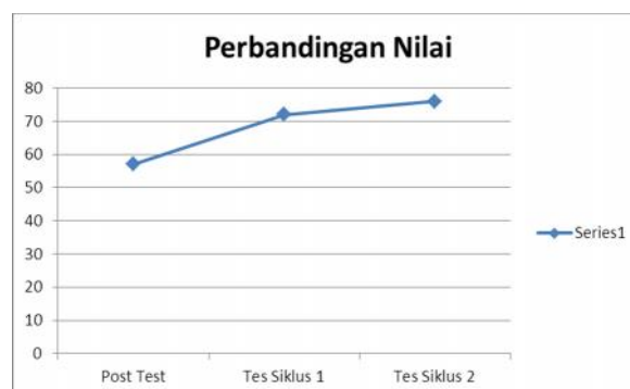
Gambar 2 : Grafik perbandingan rata-rata kemampuan pemecahan masalah

Berdasarkan gambar 1 di atas dapat dilihat bahwa dari pretest hingga siklus II mengalami peningkatan yang cukup signifikan. Jika dibandingkan kemampuan pemecahan masalah antara pretes dan siklus I, semua mahasiswa mengalami peningkatan. Terdapat beberapa mahasiswa yang mengalami penurunan kemampuan pemecahan masalah pada siklus II jika dibandingkan dengan siklus I. Hal tersebut wajar dikarenakan tingkat kesulitan materi siklus II lebih tinggi dari siklus I.