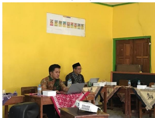
Gambar 2. Penyampaian Materi Pembelajaran Kelas Online