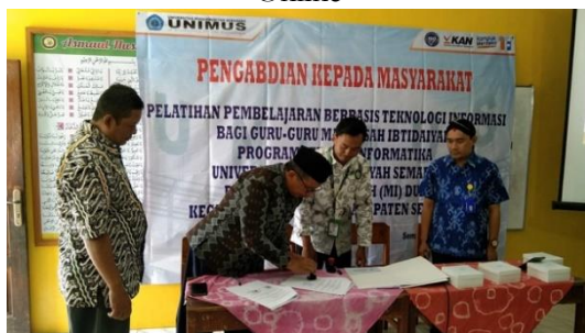
Gambar 3. Penyampaian Materi Pembelajaran Kelas Online

Menindaklanjuti penyesuaian atas dampak dan keberlanjutan program dengan mengadakan perjanjian kerja sama antar lembaga. Gambar 4, menunjukkan penandatanganan antara Program Studi Informatika, Madrasah Ibtidayah (MI) Desa Duren, dan MI Sabilul Huda Kecamatan Bandung Kabupaten Semarang.