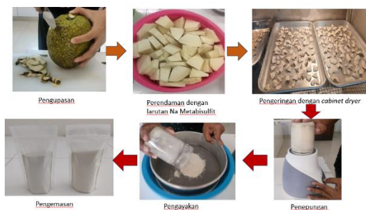
Gambar 3: Aplikasi Teknologi Sederhana Pembuatan Tepung Sukun

Aplikasi teknologi sederhana pengolahan tepung sukun dilakukan dengan tahapan: pengupasan, pemotongan, perendaman dalam larutan Na Metabisulfit 1 %, dengan perbandingan air: sukun (3:1); selanjutnya dilakukan penirisan, pencucian dan pengeringan menggunakan cabinet dryer pada suhu 60°C, kemudian dihancurkan, diayak dan dikemas. Aplikasi teknologi pengeringan sukun disajikan pada Gambar 3.