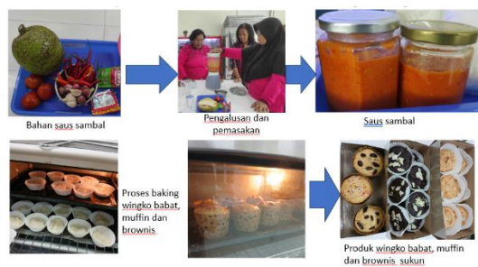
Gambar 4: Aplikasi teknologi sederhana pengolahan sukun

Teknologi sederhana pengolahan saos berbahan sukun dikenalkan kepada peserta PkM ini, mempertimbangkan bahan dan proses yang sangat sederhana. Sukun yang digunakan sebagai campuran saos ini bisa ditambahkan dalam bentuk segar melalui proses pengukusan kemudian dihaluskan menjadi pure, dan dalam bentuk tepung. Pembuatan saos pada praktikum PkM ini digunakan saos segar yang dikukus. Hasil yang diperoleh memiliki cita rasa sebagaimana saos pada umumnya. Penambahan sukun tidak banyak memberikan pengaruh pada produk. Sebagaimana temuan Azizah dan Rahayu (2017) bahwa penambahan tepung pra-masak buah sukun 1% memberikan hasil saos dengan karakteristik yang disukai panelis. Gambar 4 menunjukkan produk hasil olahan sukun kegiatan PkM ini