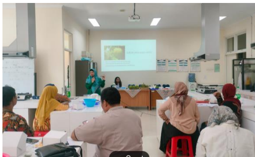
Gambar 1: Pemberian Materi Potensi sukun

Perlakuan-perlakuan dan optimasi proses yang diperlukan perlu diketahui sebelum pengolahan sehingga diperoleh hasil pengolahan yang lebih baik. Informasi ini sangat penting dilakukan, karena secara umum masyarakat belum banyak mengetahui tentang teknologi sederhana yang diperlukan. Transfer informasi teoritis diikuti oleh semua peserta dengan sangat baik. Indikator yang ditunjukkan adalah perhatian penuh serta respon serta partisipasi peserta sebagaimana ditunjukkan pada Gambar 1.