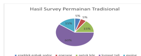
Hasil Survei Permainan Tradisional yang Diketahui Anak Sekolah

Kebanyakan, saat pulang dari sekolah, anak bermain gadget di rumah. Pasalnya, orang tua memperbolehkan anaknya bermain gadget supaya tidak bermain jauh dari rumah. Oleh karena itu, diperlukan upaya penetapan batasan penggunaan gadget untuk mengurangi penggunaan gadget dari sekolah maupun orang tua.