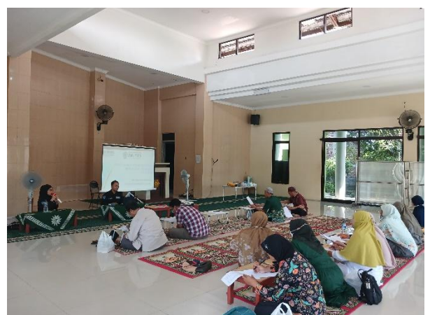
Gambar 4. Sesi Post-Test