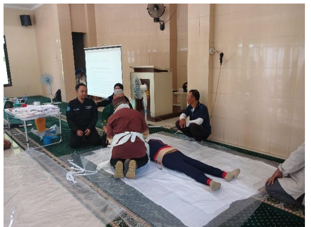
Gambar 3. Sesi Praktik Kader

Keselamatan dan kesehatan petugas yang menangani jenazah sangat penting, oleh karena itu sebelum melakukan pemulasaraan, petugas harus memastikan bahwa bahan dan sarana mencuci tangan, APD, dan persediaan pembersihan dan disinfeksi tersedia(SUTARYONO, 2021).