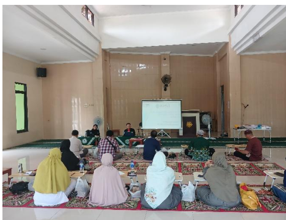
Gambar 2. Sesi Pemaparan Teori