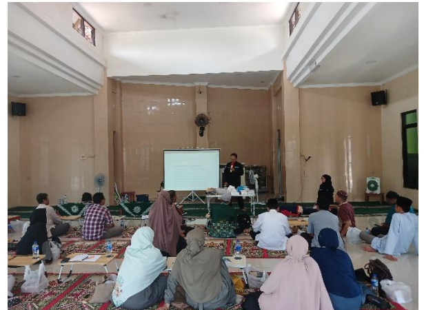
Gambar 3. Sesi Demonstrasi

jenazahnya itu sebanyak empat puluh orang yang semuanya tidak menyekutukan sesuatu dengan Allah, melainkan Allah akan mengaruniakan syafaat kepada orang yang mati tadi. "(Harahap, 2020). Jika didapati seseorang meninggal dalam kondisi terkonfirmasi penyakit menular, dipastikan prosesi pelaksanaan perawatan jenazahnya akan mengikuti pedoman dari tim medis yang sesuai dengan protocol kesehatan agar tidak menular.