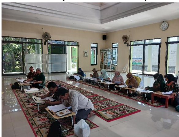
Gambar 1. Sesi Pre-Test