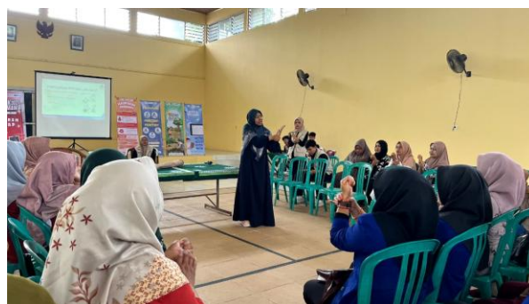
Gambar 7 Praktik Pertolongan Pertama Perdarahan dan Keracunan