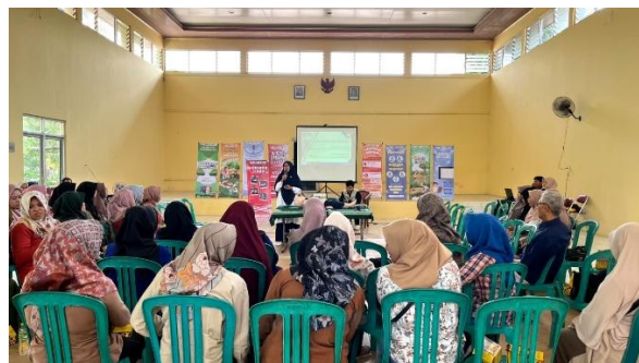
Gambar 6 Pemaparan Materi Pertolongan Pertama Kejang Demam