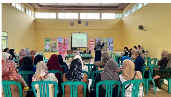
Gambar 5 Pemaparan Materi Pertolongan Pertama Perdarahan Dan Keracunan

Meskipun terdapat kendala kecil seperti keterbatasan waktu untuk sesi praktik yang lebih panjang, tim narasumber berhasil mengelola waktu dengan efisien. Pelatihan ini diharapkan dapat memberikan dampak positif bagi pelayanan kesehatan di Posyandu dan meningkatkan kesiapsiagaan kader dalam menghadapi kondisi darurat. Sebagai tindak lanjut, akan dilakukan monitoring berkala terhadap penerapan ilmu yang telah didapat oleh para kader.