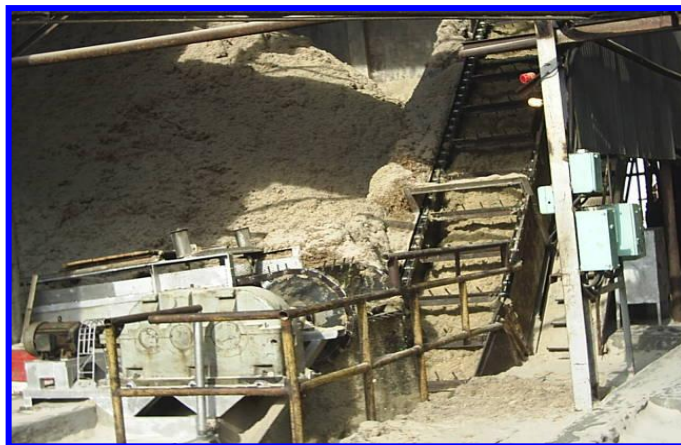
Gambar 3. Ampas Hasil Penggilingan Tebu

Setiap proses pembakaran, pasti ada sisa hasil pembakaran. Begitu juga pada proses pembakaran bahan bakar pada pabrik gula. Sisa pembakaran tersebut berupa panas yang terbuang akibat rugi-rugi, karena tidak seluruhnya energi kalor yang digunakan dapat dimanfaatkan semua untuk proses pembakaran. Sisa pembakaran yang lain adalah fly ash dan bottom ash . Untuk menangani bottom ash , digunakan conveyor dengan sistem terendam air agar abu yang dihasilkan tidak berterbangan. Untuk menangani fly ash digunakan sistem cyclone agar partikel-partikel yang berat jatuh ke bawah untuk mengurangi polusi lingkungan.