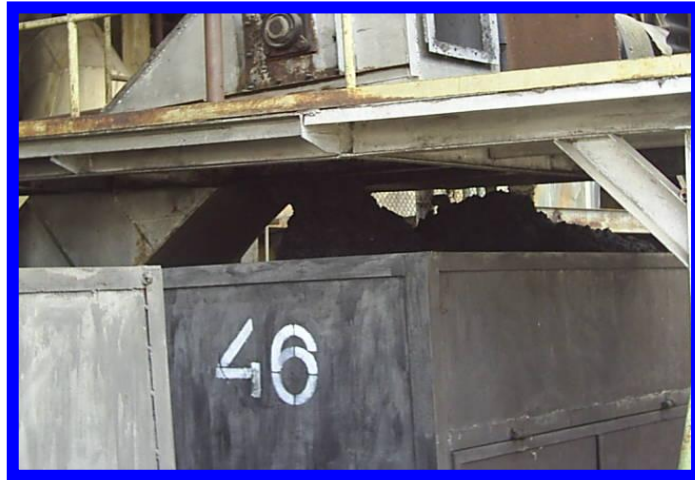
Gambar 4. Abu Ketel Ditampung Menggunakan Troli

ketel tersebut dibawa ke tempat pembuangan yang lokasinya jauh dari pemukiman penduduk.