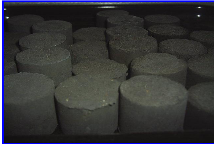
Gambar 6. Briket Bioarang