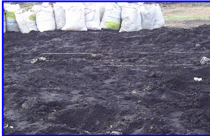
Gambar 1. Limbah Sisa Pembakaran Bahan Bakar Pabrik Gula

Berdasarkan terjadinya bahan bakar dapat dibedakan menjadi dua golongan yaitu bahan bakar alami dan bahan bakar buatan.