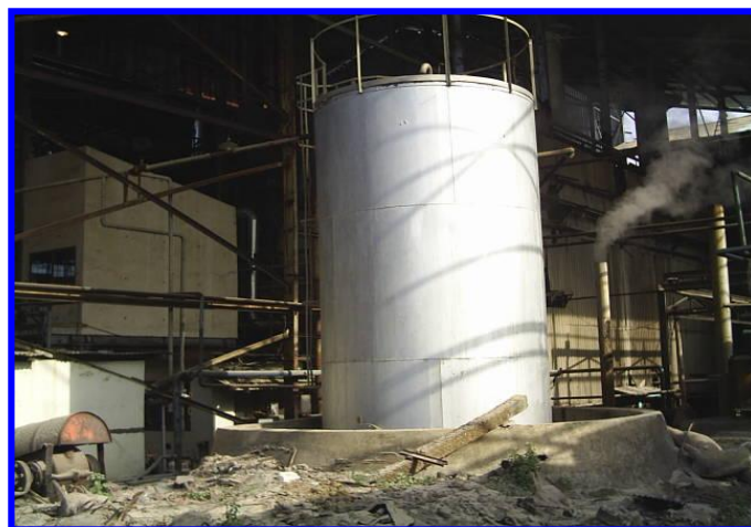
Gambar 2. Delay Tank Tempat Supply Residu

Pabrik gula membutuhkan bahan bakar untuk menjalankan proses produksinya. Pada pabrik gula (khususnya PG. Trangkil), menggunakan dua macam bahan bakar, yaitu bahan bakar cair dan bahan bakar padat. Bahan bakar cair yang digunakan adalah residu. Minyak residu adalah hasil pengolahan minyak bumi dengan kualitas di bawah solar dan di atas aspal.