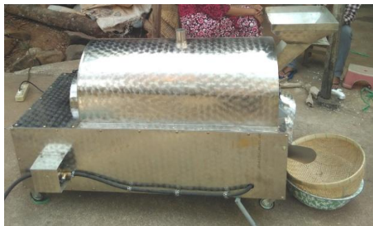
Gambar 4.1 Gambar Mesin Penyangrai

Gambaran mesin penyangrai dapat dilihat pada gambar 4.1 berikut ini.