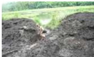
Gambar 3. Humus eceng gondok

Diskusi selanjutnya berupa penentuan kegiatan penyuluhan dan pengembangan karang taruna. Berdasarkan analisis kebutuhan diperoleh bahwa budidaya jamur campignon tidak jauh berbeda dengan jamur merang. Adanya beberapa kendala budidaya jamur campignon (suhu asinan yang mengalami kenaikan pada tahun terakhir) asinan maka dilakukan pencarian solusi, akhirnya ditinjau dari akar permasalahan diperoleh solusi yaitu budidaya jamur merang menggunakan substrat enceng gondok. Bahan baku media budidaya jamur champignon/merang, berupa media organik yang mengandung banyak selulosa, misal jerami atau enceng gondok. Hasil observasi menunjukkan bahwa humus yang sudah jadi seperti pada gambar 1 tidak dapat digunakan sebagai media tumbuh jamur merang karena sudah tercemar kontaminan.