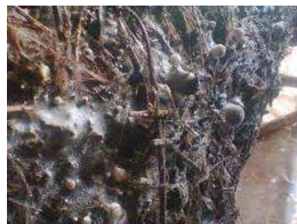
Gambar 6. Pertumbuhan miselium pada masa inkubasi.