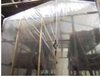
Gambar 4. Kumbung jamur merang