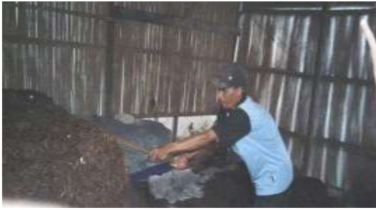
Gambar 5. Proses pengomposan media tumbuh jamur merang.