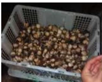
Gambar 8. Jamur merang hasil budidaya dengan eceng gondok.

Tujuan: menghindari jamur menjadi mekar, layu, salah petik dan menjaga agar memetik jamur tepat waktunya.