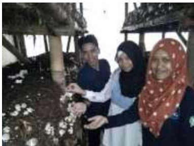
Gambar 7. Badan buah jamur merang yang sudah terbentuk.