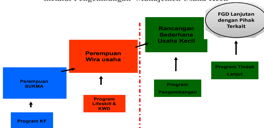
Gambar 2. Tahapan Pendampingan dan Pembinaan melalui Pengembangan Manajemen Usaha Kecil