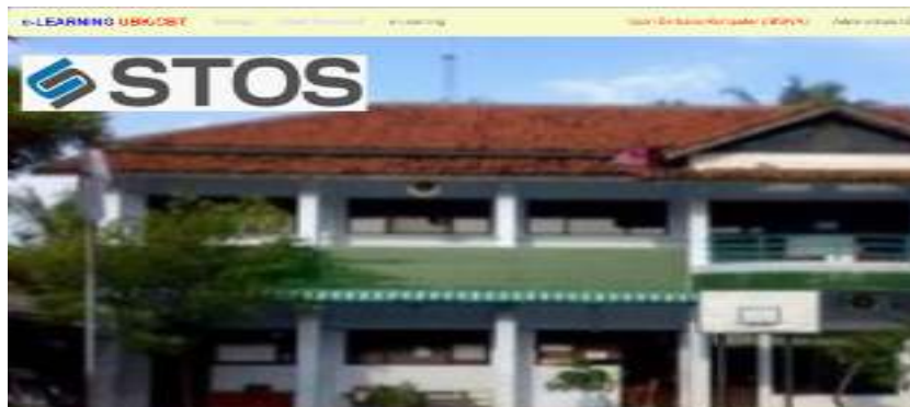
Gambar 3. Menu pertama login Smart Try Out System

Mengembangkan program aplikasi ujian nasional Online Berbasis Smart Try Out System menunjukkan antusiasme siswa dalam mengerjakan. Hal ini dikarenakan program ini akan mengenalkan mereka tentang ujian nasional yang akan dilakukan nantinya. berikut adalah beberapa tampilan keseluruhan program aplikasi ujian nasional Online Berbasis Smart Try Out System yang sudah selesai di buat.