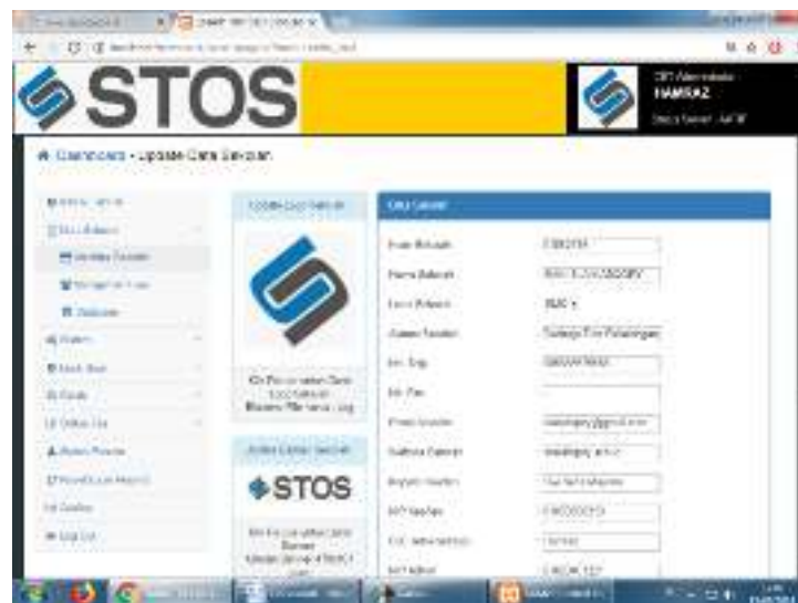
Gambar 5. Menu data sekolah Smart Try Out System

Dimenu ini terdiri dari berbagai sub menu yaitu sistem server, data sekolah, adminstrai bank soal, cetak status ujian, status peserta, reset login peserta, analisis dan log out. berikut adalah menu-menu setelah kita masuk ke masing-masing menu tersebut.