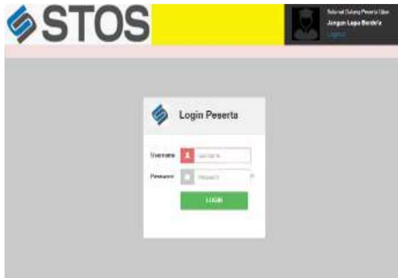
Gambar 1. Gambar menu login aplikasi Smart Try Out System

Aplikasi Smart Try Out System yaitu suatu perangkat lunak komputer yang dikembangkan untuk membantu peserta didik melakukan latihan ujian nasional. Dengan kata lain Smart Try Out System merupakan perangkat tes berbasis komputer yang dikembangkan oleh penulis sendiri. Tujuan utama dari pengembangan Smart Try Out System adalah melatih peserta didik agar lebih siap dalam menghadapi ujian tertulis yang sebenarnya. Secara khusus Smart Try Out System diharapkan dapat membantu peserta didik mengerjakan soal ujian nasional dengan mudah. Dalam Smart Try Out System , peserta didik diberikan soal untuk dikerjakan dan soal itu telah diacak oleh sistem komputer.